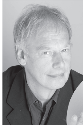
Rainer Pause Pantheon Theater Bonn www.pantheon.de